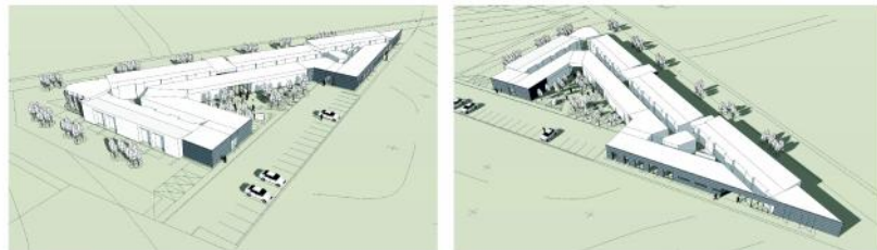
Perspektiv set fra nordøst